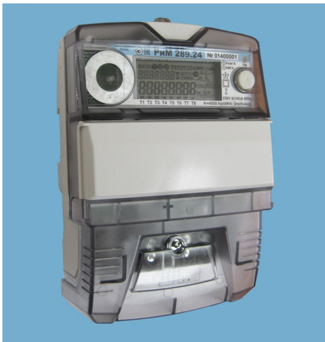
Рисунок 1 – Общий вид счетчиков РиМ 289.2Х